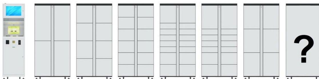
Console A B C D E F Customized